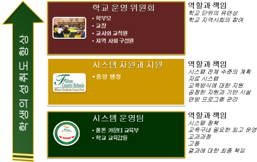
그림 3- 차터 시스템 운영

학생들의 성취도를 향상시키기 위한 이 혁신적인 차터 시스템 모델은 강력하지만, 적응이 쉬운 운영 구조와 연결되어야 함을 우리는 인식하고 있습니다.