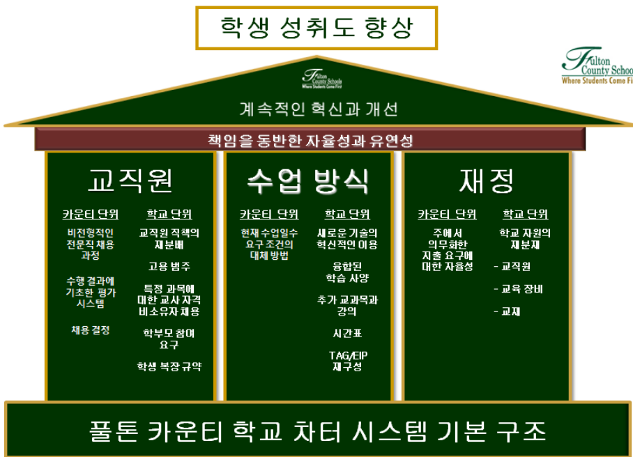
그림 2에서 강조된 것과 같이, 포괄적인 지역 사회 참여 및 연구를 바탕으로, 우리 시스템이 더욱 효과적으로 학생들의 잠재력을 키워 교육할 수 있도록 그 기본 구조를 개발하였습니다.

우리 차터 시스템 전략 초점은 세 분야인 교직원, 수업 방식, 그리고 재정에 대한 혁신적인 창출을 통해 학생들의 수행도를 향상하도록 하는 것입니다. 이 차터 시스템 구조는 5년에 걸쳐 신중하게 이행될 것입니다.